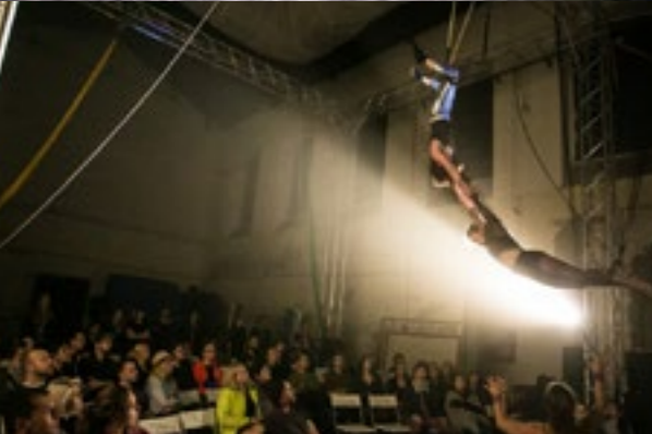
The Leftovers Company