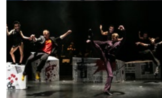
DEKKADANCERS / Poslední večere