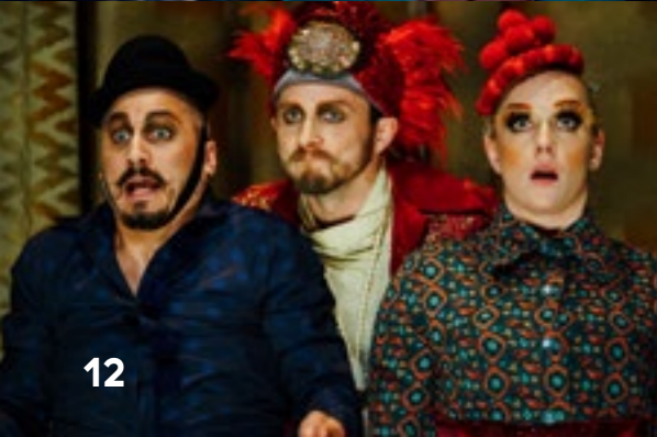
Cirk La Putyka / Batacchio