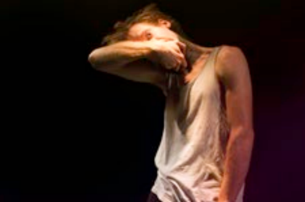
Kallo Collective / Only Bones