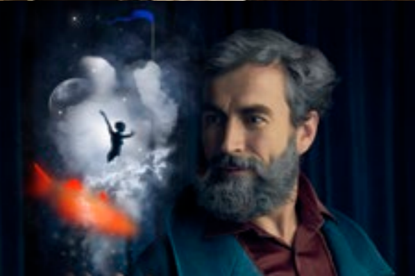
Naïve Man Company / Prospero