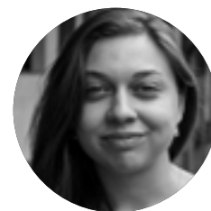
Produkce Alžběta Hocková