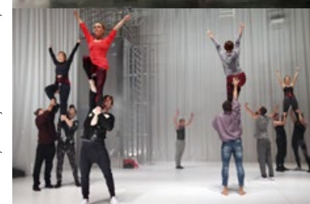
Cirk La Putyka &amp; Dejvické divadlo / Honey