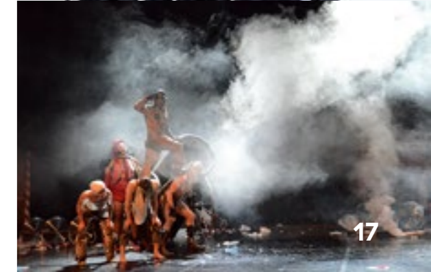
Burnt Out Punks / Smoke Screens