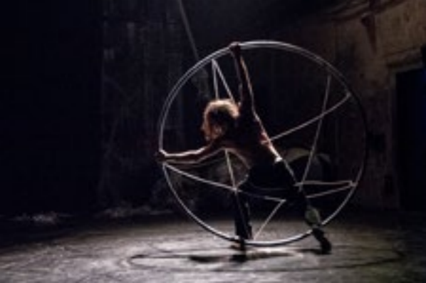
Le Quatrième Corollaire / The Fear of Umbrellas