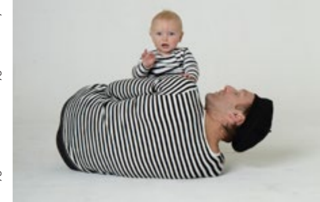
Trygve Wakenshaw / Trygve vs a Baby