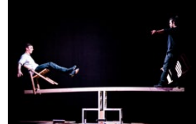
Kolektiv Lapso Cirk / OVVO