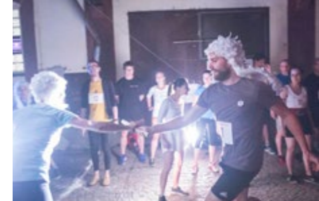
Velká holešovická 2017

V průběhu roku 2017 se na Jatkách78 odehrálo 35 dětských představení. Naprostá většina z nich proběhla o sobotních odpoledních a byla následována tematickým workshopem. Mimo tato dětská představení Jatka78 nabídla ve svém repertoáru celou řadu tzv. rodinných představení určených rodičům s dětmi. Jen a pouze pro děti jsme opět připravili deset představení Mikulášská Jatka, která se stala po úspěchu z loňských let opět velmi očekávanou předvánoční divadelní událostí. V červnu jsme také uskutečnili minifestival Ukončete nástup, dveře se otvírají, na kterém připravujeme děti pomocí divadelních představení a výtvarných a akrobatických workshopů na blížící se prázdniny. Kromě samotného programu se průběžně snažíme samotný prostor divadla upravovat tak, aby byl co nejvíce atraktivní právě pro děti. Vyplatí se to.