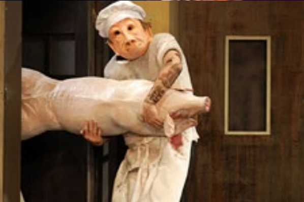
Familie Flöz / Hotel Paradiso